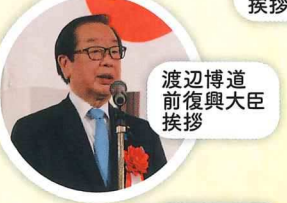
渡辺博道 前復興大臣 挨拶