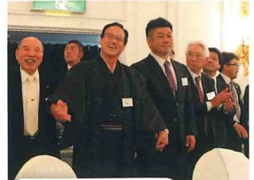
輪になって楽しそう