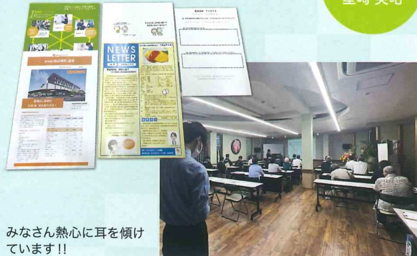
みなさん熱心に耳を傾けています!!