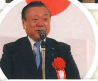
櫻田義孝 元五輪担当大臣挨拶